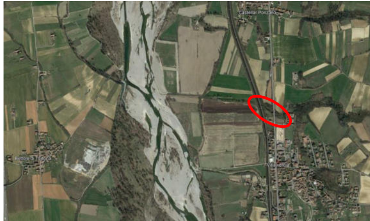
Fig. 1 – Inquadramento territoriale

Sono previsti attraversamenti della ferrovia e della strada statale a livello del rio, per cui si predispongono idonea domanda di autorizzazione.