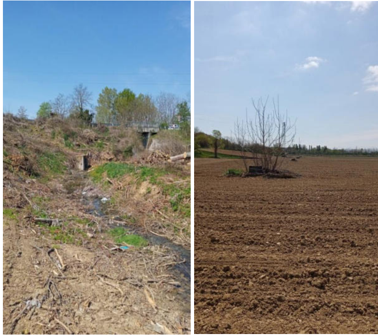
Figg. 3-4 – Foto stato attuale e pozzetti della rete fognaria esistente