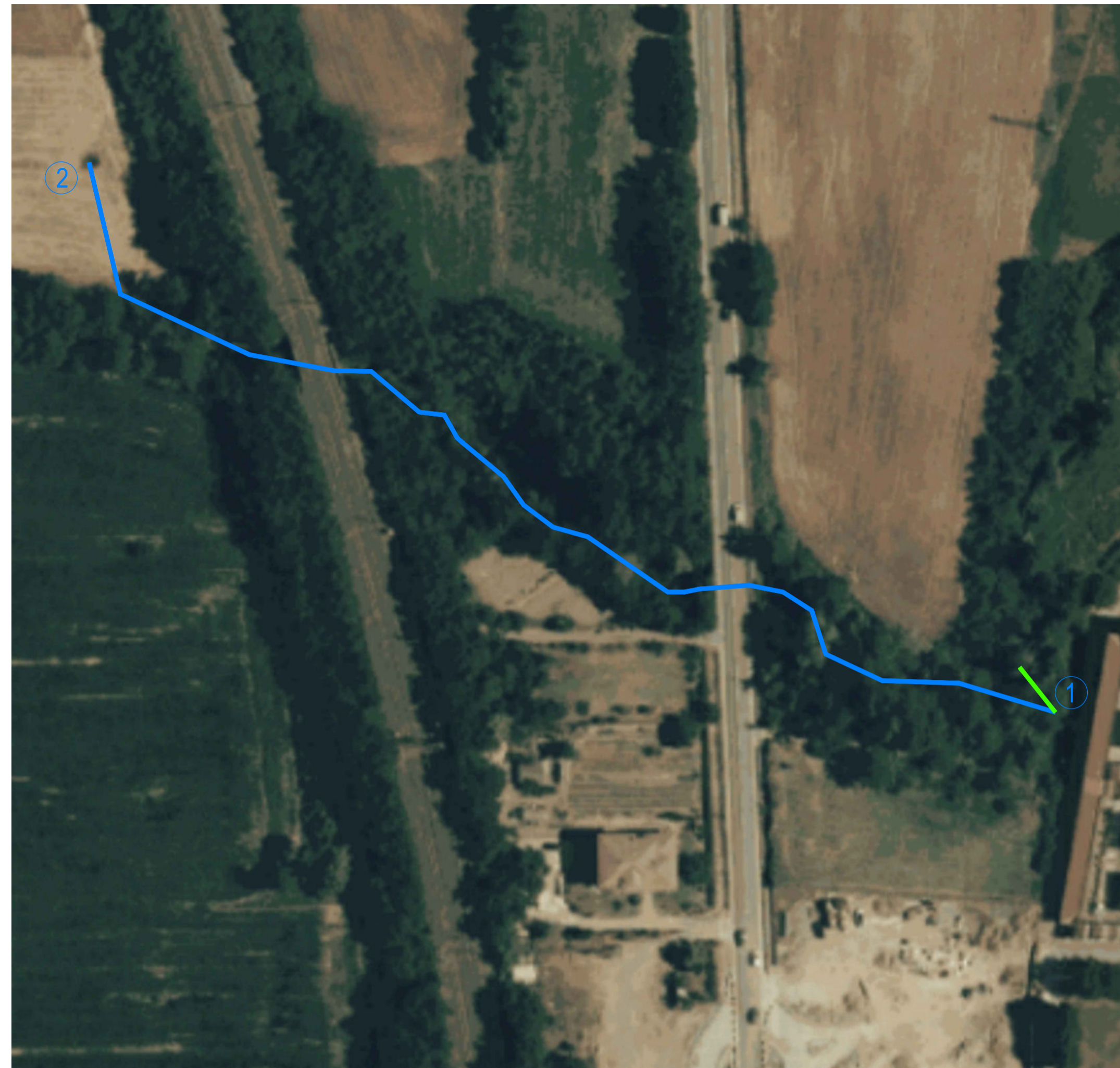
ORTOFOTO scala 1:1000